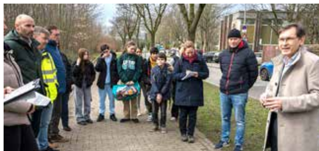
Der Oberbürgermeister (rechts) bei der offiziellen Übergabe des Projekts.